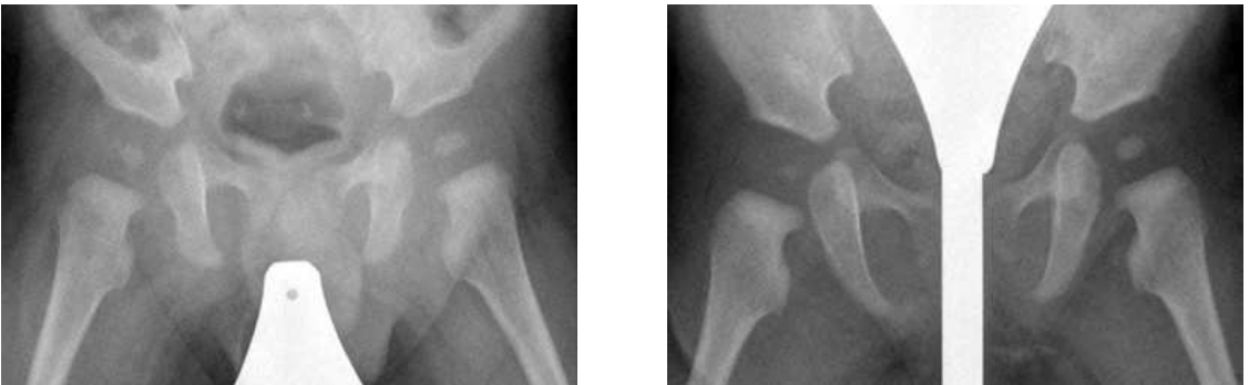
図5-1 小児股関節のX線写真（左；男子，右；女子）

股関節の撮影で問題となるのが，生殖腺（男子は睾丸，女子は卵巣）への被ばくです。撮影回数も多くなることが予想されますから，小児の場合，診断できる範囲内で被ばく線量を少なくするための努力をおこなっています。例えば，放射線を透さない鉛などで生殖腺を覆って（男子では睾丸を，女子では卵巣のある下腹部を遮蔽します。図5-1）撮影します。