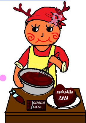
大和なでしこ マスコットキャラクター なでしこちゃん

生検はチョコッと採取するだけのようで、奥が深い！！普段携わっている方もそうでない方も一緒に勉強しましょう！